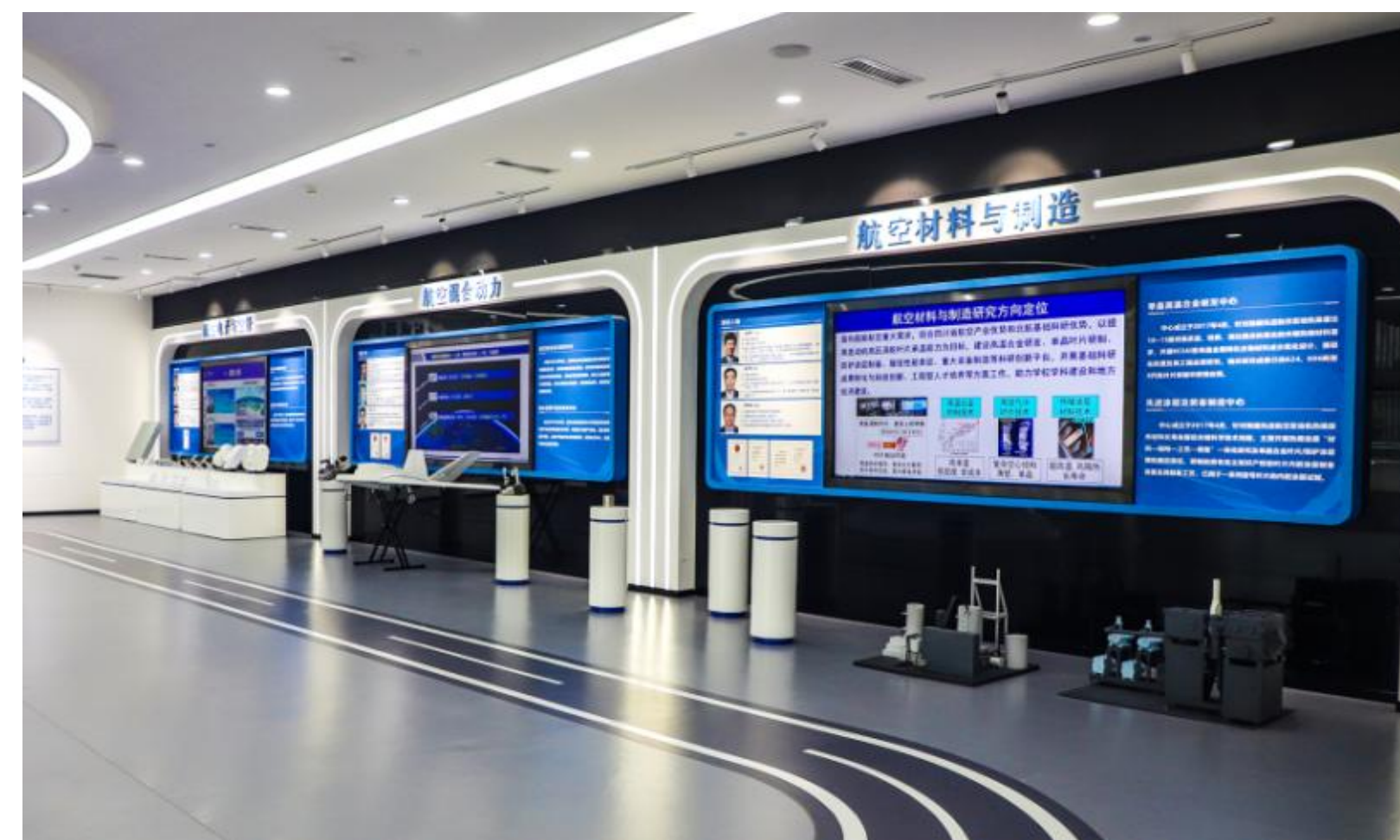
高校科研成果展示