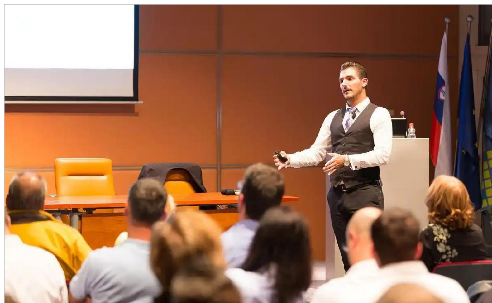
产学研分享会及成果转化签约仪式